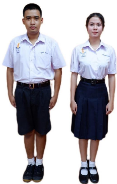
ตัวอย่างการแต่งกายชุดนักเรียน ระดับชั้นมัธยมศึกษาตอนปลาย

๒.๓.๕ รองเท้า ใช้รองเท้านุ่มสันสีดำ ชนิดผูกเชือก ทำด้วยหนังหรือวัสดุเทียมหนังสีดำ มีรูสำหรับร้อยเชือกไม่น้อยกว่าสองคู่และไม่เกินหกคู่สันใหญ่และสูงพอสมควร