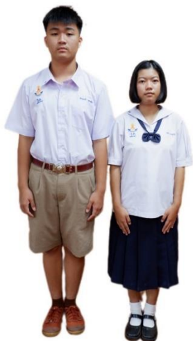
ตัวอย่างการแต่งกายชุดนักเรียน ระดับชั้นมัธยมศึกษาตอนต้น

เสื้อ เสื้อยูวกาชาดสีฟ้าอมเทา แขนสั้น ติดป้ายโรงเรียนที่ต้นแขนขวาต่ำจากตะเข็บไหล่ ๑ เซนติเมตร ปักชื่อและนามสกุลด้วยไหมสีน้ำเงินบนผ้าขาว แล้วเย็บลงบนเสื้อเหนือกระเป๋าด้านขวา ผ้าผูกคอยูวกาชาดสีน้ำเงิน มีเครื่องหมายกาชาด กระโปรง กระโปรงยูวกาชาดสีฟ้าอมเทาจีบรอบ เข็มขัดยูวกาชาดสีดำ ถุงเท้าสีขาว รองเท้าสีดำ และหมวกยูวกาชาดสีน้ำเงิน ติดเข็มกาชาดที่หน้าหมวก