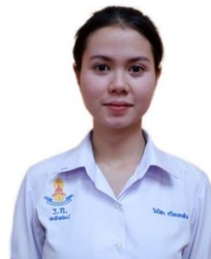
ตัวอย่างการปักเครื่องหมายโรงเรียน ระดับชั้นมัธยมศึกษาตอนปลาย