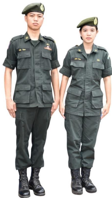
ตัวอย่างการแต่งกายชุดนักศึกษาวิชาทหาร ระดับชั้นมัธยมศึกษาตอนปลาย