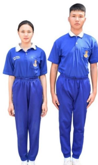
ตัวอย่างการแต่งกายชุดพลศึกษา ระดับชั้นมัธยมศึกษาตอนปลาย