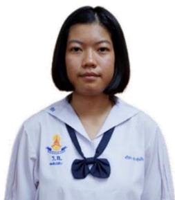
ตัวอย่างการปักเครื่องหมายโรงเรียน ระดับชั้นมัธยมศึกษาตอนต้น

๓.๒ นักเรียนระดับชั้นมัธยมศึกษาตอนปลาย ต้องปักเครื่องหมายรูปมหาพิชัยมงกุฎติดที่อกเสื้อ ด้านขวามือเหนือแนวราวนม มีอักษรย่อ “ร.ก.” ที่อกเสื้อด้านขวามือเหนือราวนม ได้มหาพิชัยมงกุฎ ติดบนเสื้อด้วย ด้ายหรือไหมสีน้ำเงินแก่ แบบตัวพิมพ์ธรรมดา ขนาดตัวอักษรสูง ๑.๕ เซนติเมตร ได้อักษรย่อโรงเรียนเป็นเลข ประจำตัวบนเสื้อ หน้าอกด้านขวาเป็นตัวเลขไทยขนาดสูง ๑.๒ เซนติเมตร มีชื่อและนามสกุลของนักเรียนปักด้วย ด้ายหรือไหมสีน้ำเงินแก่แบบตัวพิมพ์ธรรมดาขนาดตัวอักษรสูง ๑.๒ เซนติเมตรติดบนเสื้อหน้าอกด้านซ้าย มีจุด ที่ปักคอเสื้อด้านขวามือ จำนวนตามระดับ