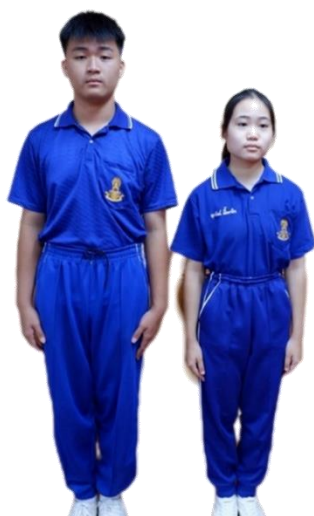
ตัวอย่างการแต่งกายชุดพลศึกษา ระดับชั้นมัธยมศึกษาตอนต้น

๔.๓ ในวันที่ไม่มีชั่วโมงเรียนวิชาพลศึกษา ห้ามนักเรียนสวมชุดพลศึกษามาโรงเรียน และห้ามนักเรียนสวมชุดพลศึกษา ร่วมกับกางเกงนักเรียนหรือกระโปรงนักเรียน หรือเสืื่อนักเรียนร่วมกับกางเกง พลศึกษาในเวลาเดียวกัน มาเรียน ในชั่วโมงเรียนวิชาพลศึกษา หรือวันปกติโดยเด็ดขาด เว้นแต่ได้รับอนุญาต