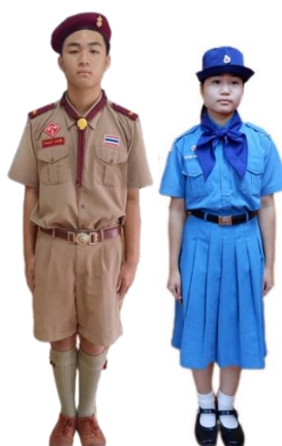
ตัวอย่างการแต่งกายชุดยูวกาชาด-ชุดลูกเสือ ระดับชั้นมัธยมศึกษาตอนต้น